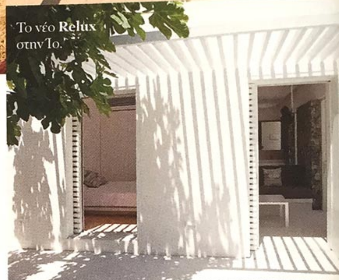
Το νέο Relux στην Ίο.