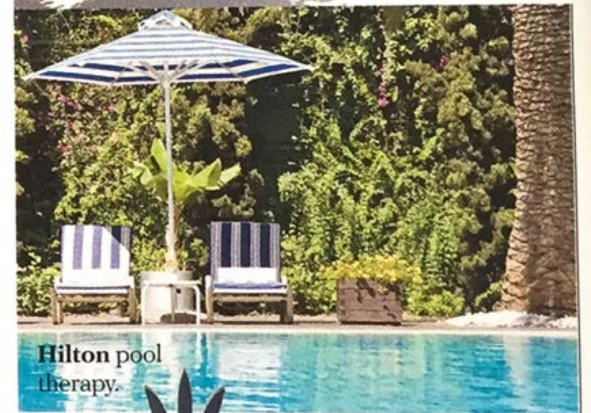
Hilton pool therapy.