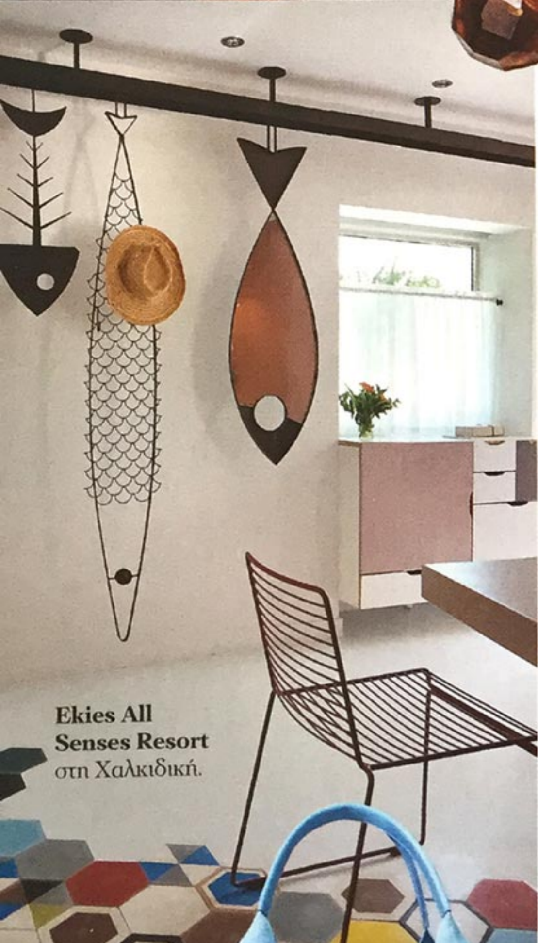
Ekies All Senses Resort στη Χαλκιδική.

Τ Ο SOROS BEACH στην Αντίπαρο, πάνω στην αμμουδιά του Σωρού, με τα βαθιά, καταγάλανα νερά, συνδυάζει τη χαλαρότητα του beach bar με τη βολική διαιμονή σε ένα από τα επτά απλά δωμάτια ή τις σουίτες του ( www.sorosbeach.gr ). Στο Ekies της Χαλκιδικής, οι νέες eco-luxury σουίτες δίνουν έμφαση στα αδρά υλικά της φύσης, προσφέροντας μια laid-back αίσθηση ( ekies.gr ). Στη μαρίνα της Ίου άνοιξε το μινιμαλιστικής αισθητικής boutique hotel Relux Ios ( www.reluxios.com ). Αν βρίσκεστε στην Αθήνα, μια βουτιά στην πισίνα του Hilton –τη μεγαλύτερη του κέντρου– θα σας θυμίσει ότι είναι καλοκαίρι. Στην Αθηναϊκή Ριβιέρα, από την άλλη, η διάχυτη ξενοιαστη διάθεση θα σας κάνει να ξεχάσετε ότι βρίσκεστε στην πόλη. Στην Astir Beach, τα νερά δεν μας προδίδουν ποτέ, ούτε φυσικά και οι ανέσεις: XL ξαπλώστρες, power